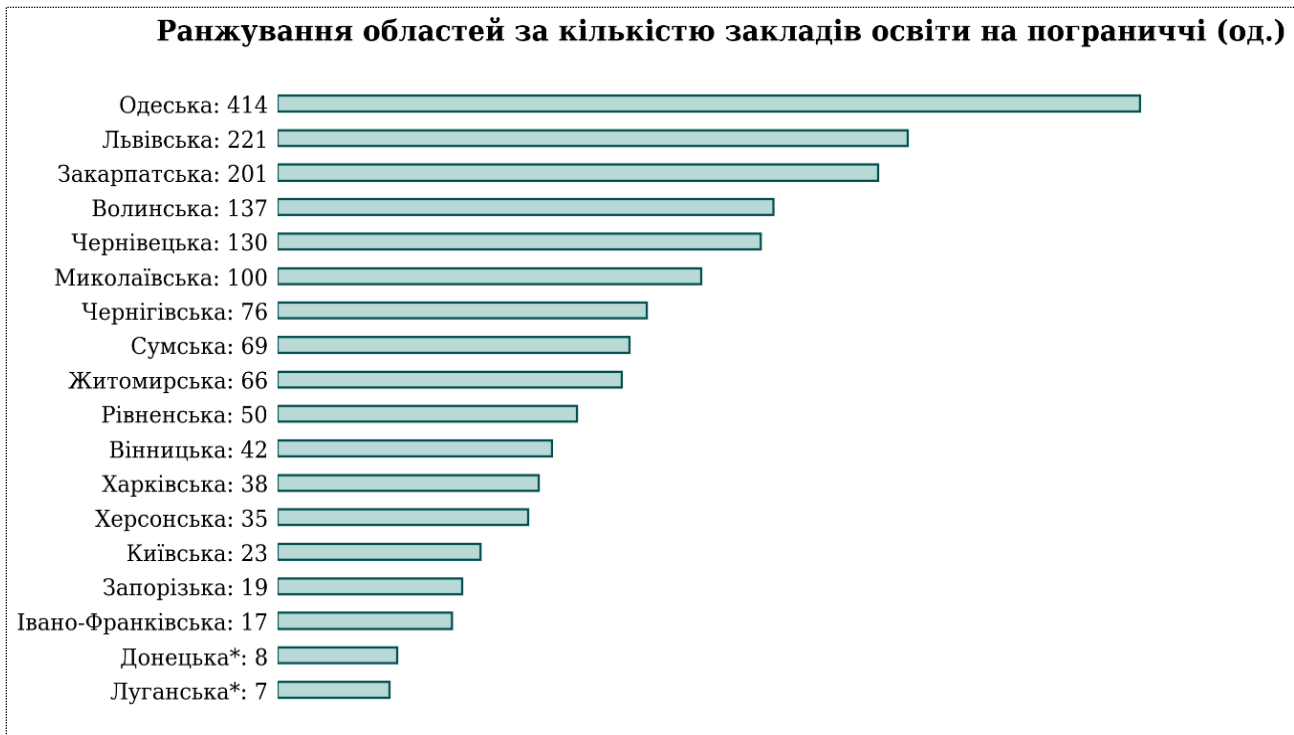
Рисунок 2. Ранжування областей за кількістю закладів загальної середньої освіти у територіальних громадах, розташованих на пограниччі (од.)

Складено авторами самостійно за даними: Публічні дашборди та інформаційні довідки МОН, 2024.