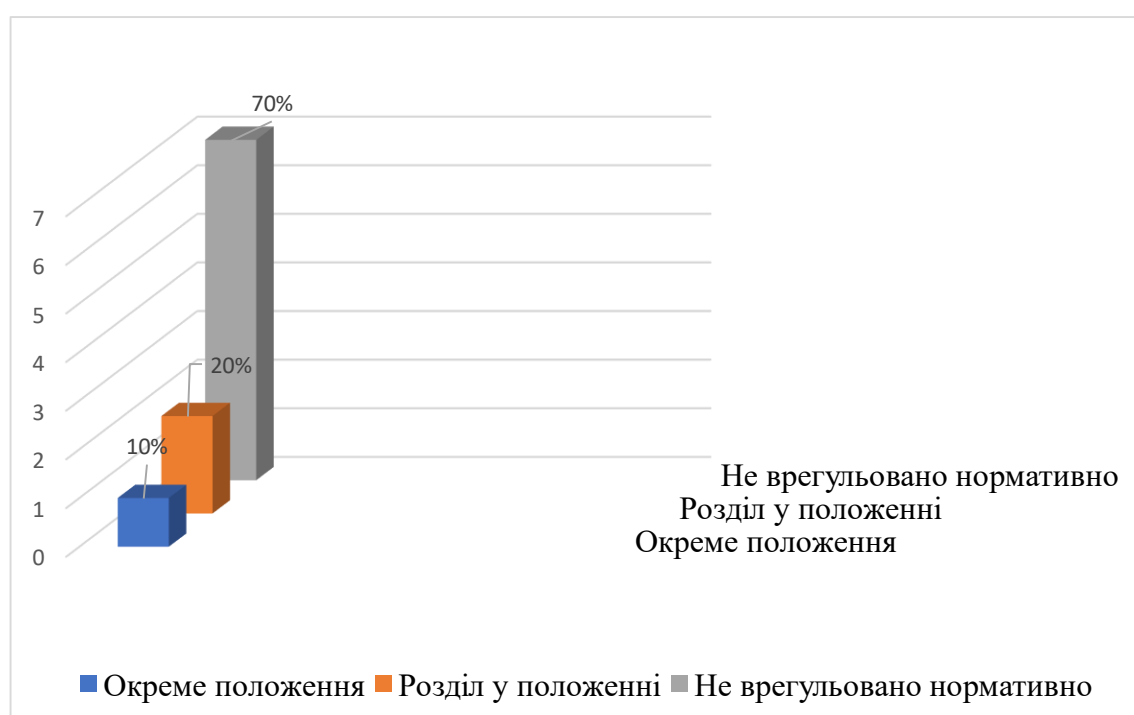
Рисунок 1. Представлення soft skills у внутрішніх нормативних документах закладів вищої освіти

За результатами аналізу встановлено, що з десяти досліджених закладів вищої освіти лише в одному наявне окреме внутрішнє нормативне положення, яке регулює процес формування і розвитку soft skills («Положення про формування soft skills в учасників освітнього процесу» (Харківський національний педагогічний університет імені Г. С. Сковороди). Також у ряді університетів розвиток soft skills розглядається у межах загальних норм «Положення про організацію освітнього процесу» (Ужгородський національний університет; Київський національний університет імені Тараса Шевченка) (Рисунок 1). У більшості ж розглянутих закладів освіти цей аспект або інтегрується фрагментарно в загальні документи, або не має чіткого нормативного закріплення.