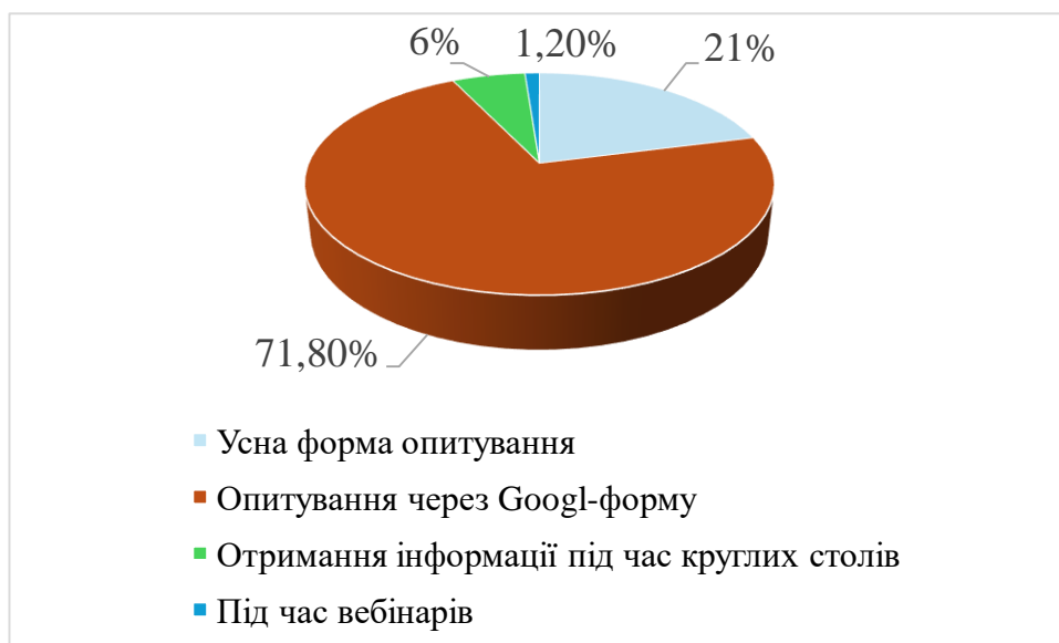
Рисунок 1. Форми опитування вчителів м. Києва

Розподіл респондентів за формами опитування в рамках нашого дослідження подано на Рисунку 1.