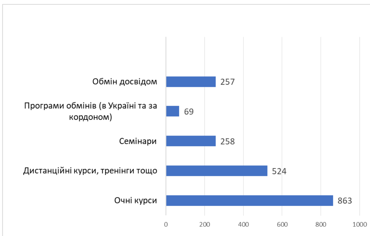
Рисунок 3. Яким формам підвищення кваліфікації Ви надасте перевагу? Складено автором самостійно

На прохання вказати теми, за якими вчителі найбільше хотіли б підвищувати власну фахову кваліфікацію ми отримали наступні відповіді (Рисунок 4):