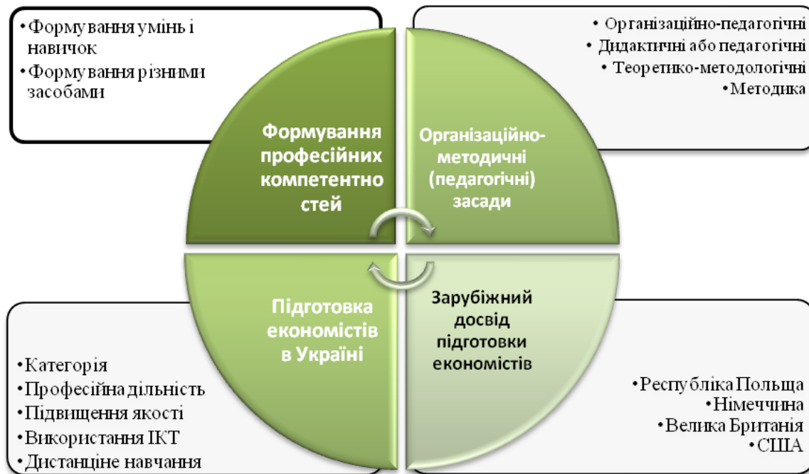
Рисунок 3. Тематика наукових досліджень підготовки економістів