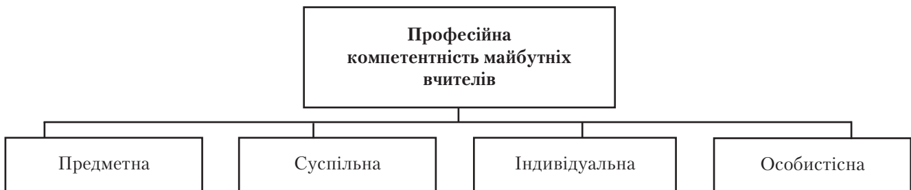
Рис. 1. Основні види професійної компетентності майбутніх вчителів

На Рис. 1 представлені основні види професійної компетентності майбутніх вчителів, що формуються на етапі їх підготовки в педагогічному закладі освіти.