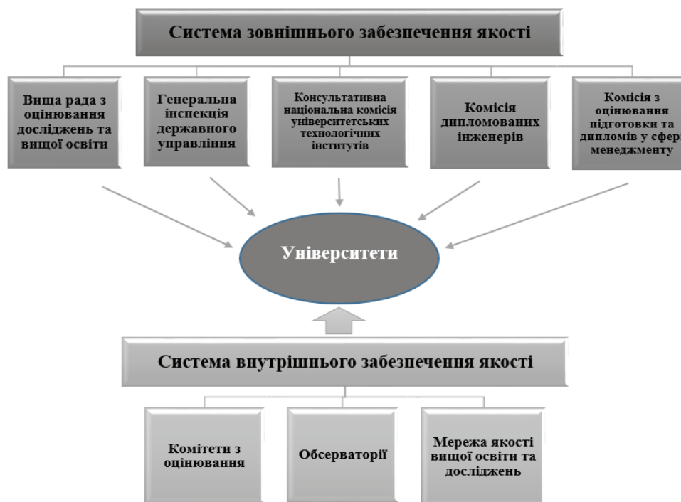
Рис. 2. Структура системи забезпечення якості вищої освіти Франції