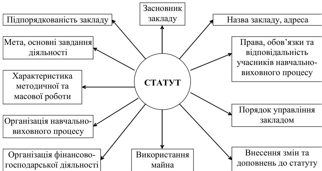
Рис.1. Структурні компоненти Статуту позашкільного навчального закладу

За допомогою рисунка 1 розглянемо структуру такого Статуту.