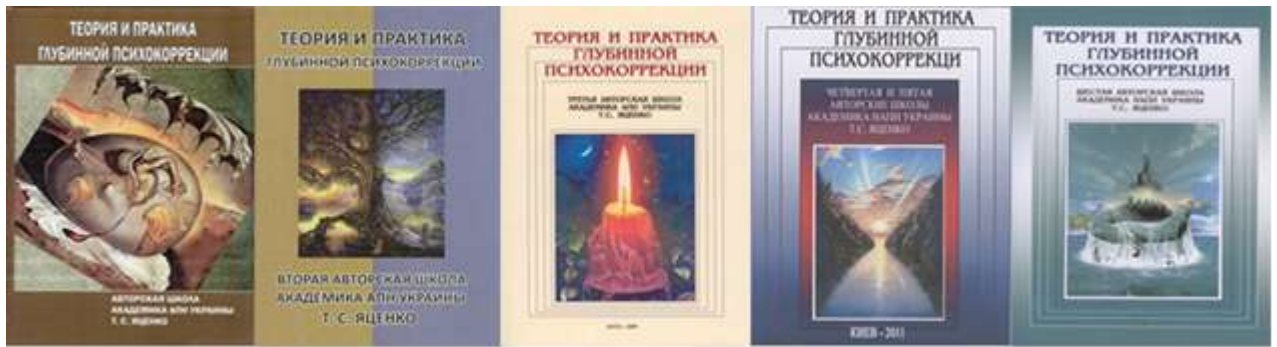
Фото 1. Книги по Авторським школам

Більш як 30-літній досвід Т. С. Яценко в галузі глибинної корекції призвів до необхідності його філософського осмислення і узагальнення, чому сприяє співпраця з ректором Національного педагогічного університету імені М. П. Драгоманова, доктором філософських наук, професором, академіком НАПН України В. П. Андрущенко (див. [26, 27, 28]). Це надало нового мета-дихання психодинамічній теорії і відповідній практиці глибинної корекції. Як наслідок – створено науково-дослідну лабораторію глибинної корекції (далі Лабораторію) при Національному педагогічному університеті імені М. П. Драгоманова (рішенням Вченої ради від 26 грудня 2011 р.), на базі Інституту педагогіки і психології (м. Київ) за активної участі його директора академіка НАПН України В. І. Бондаря. Центр (спільно з Лабораторією) двічі на рік проводить: наукові сесії для дослідників, аспірантів і докторантів з різних проблем глибинно-психологічного пізнання цілісної психіки; Всеукраїнський семінар з проблем глибинного пізнання (з щорічною конкретизацією тематики), що відображають відповідні збірники статей, видані при НПУ імені М. П. Драгоманова [21 – 27].