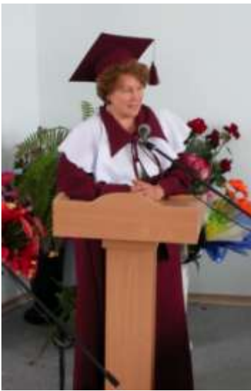
Академік НАПН України Т. С. Яценко

Основи психодинамічної теорії в Україні сформовані академіком Національної академії педагогічних наук України Яценко Тамарою Семенівною. Зародження даного підходу можна віднести до 1978-1979 рр., що знайшло втілення в розробці методу активного соціально-психологічного навчання (АСПН), який спочатку був зорієнтований на оптимізацію спілкування вчителя з учнями (докторська дисертація (1989 р., при консультативній підтримці академіка РАО О. О. Бодальова [1]). Поштовхом до науково-практичних пошуків послугувала практика соціально-психологічного тренінгу (СПТ) в Москві і Новосибірську, стажування з групової психотерапії в Ленінграді (Санкт-Петербург), Польщі (Варшава, Гданськ).