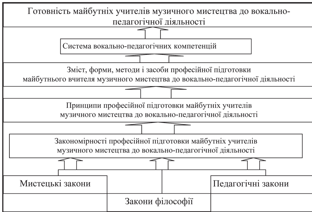
Рис.1. Детермінованість законів, закономірностей і принципів у професійній підготовці майбутніх учителів музичного мистецтва до вокально-педагогічної діяльності

ва важливим є врахування законів всезагального зв'язку : закон детермінації – усі предмети, процеси знаходяться у різних детермінованих зв'язках, відношеннях; закон висхідного і низхідного розвитку, що передбачає шлях удосконалення або шлях збідніння, зменшення; закон причинності – поява нової якості завжди має причину, одне явище обов'язково породжує інше; закони діалектики – закон єдності та боротьби протилежностей, закон переходу кількісних змін у якісні, закон заперечення.