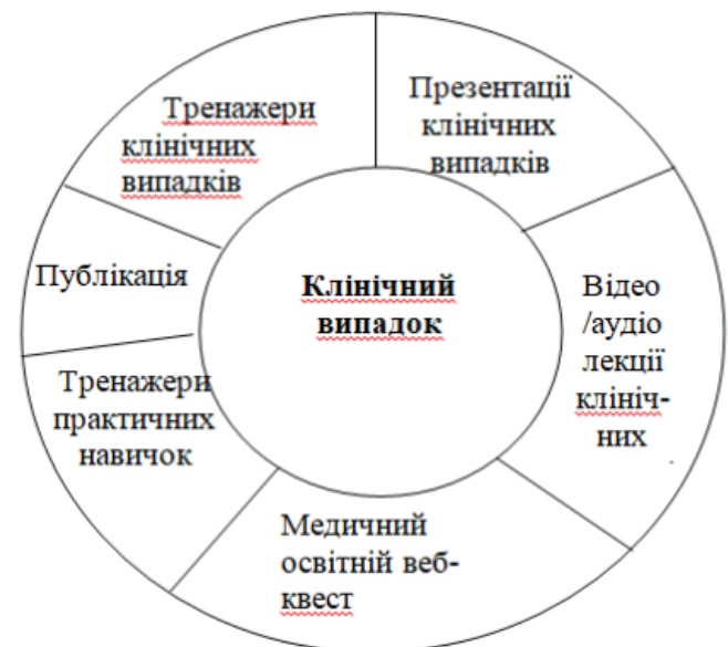
Рис.1. Структурні компоненти практично-орієнтованого кейс-методу навчання в системі безперервної медичної освіти на основі інформаційних веб-технологій

6. медичні освітні веб-квести (поєднання кількох тем з дисципліни «внутрішні хвороби» в рамках одного проблемного завдання з елементами інформаційної гри в стилі детектива, з побудовою сценарію з розгалуженням і поєднанням теоретичного матеріалу за кількома темами, з відпрацюванням практичних навичок та тестовими тренажерами).